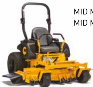
MID MOUNT Z 52-27 MID MOUNT Z 61-27