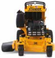
STANDER SM 3618,5