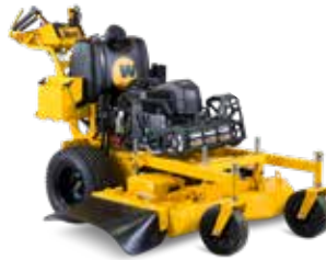
VELKE ERGO 3618,5