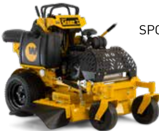
SPORT I 3619