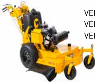
VELKE 3615 VELKE 3618,5 VELKE 4818,5