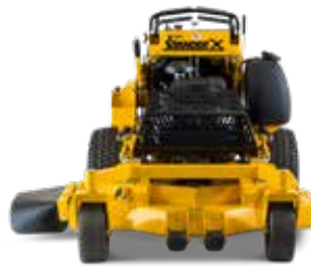
STANDER X 4823,5