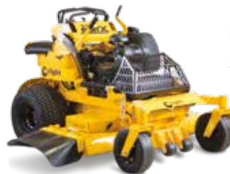
SPORT X 4823,5 SPORT X 5223,5